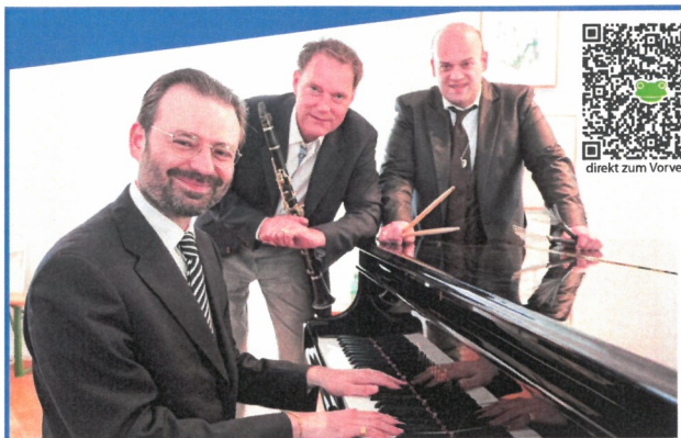
THREE WISE MEN

Konzert in der Kirche Trüllikon (CH) 18. März 2023 20.00 Uhr - Türöffnung 19.00 Uhr Eintritt CHF 45.00 / 35.00 / 25.00